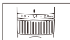
Draai de afstelring naar links en rechts om het mes af te stellen (0,8 mm - 2 mm)