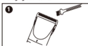
1. Reinig het mes met de borstel