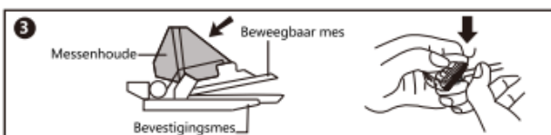
3. Het beweegbare mes kan worden teruggedraaid om het haar tussen het beweegbare mes en het bevestigingsmes te reinigen.