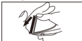
• Druk het beweegbare mes omlaag met de duim om het mes te demonteren