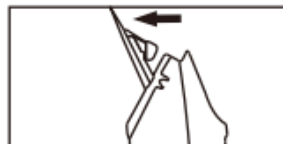
• Houd met de andere hand vast om te voorkomen dat het mes eraf valt